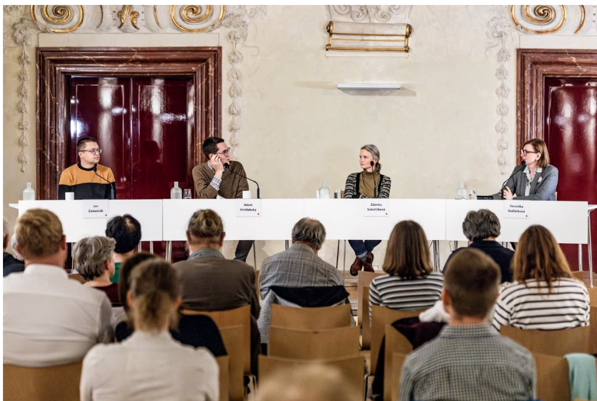
Debata Úcta ke stvoření jako duchovní úkol , foto Dominikánská 8

Během roku 2024 jsme vydali tři čísla zpravodaje pro naše odběratele, ve kterých jsme sdíleli dění ve Společném domově, zvali na akce, podporovali projekty a výzvy a také zprostředkovali knižní tipy.