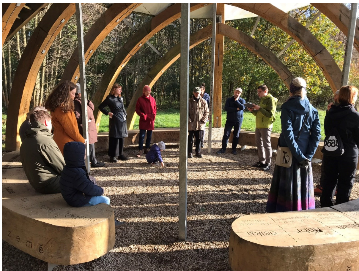
Foto z duchovní obnovy Společného domova ve Sluňákově

Po loňském roce, kdy jsme 15. dubna založili Ekumenickou síť Společný domov a v průběhu roku spustili webové stránky a uskutečnili několik prvních setkání, jsme se letos dál věnovali cíli vytvářet platformu pro propojování a dialog v prostředí českého křesťanství a environmentálního hnutí. Věnovali jsme se networkingu na různorodých akcích a také jsme iniciovali setkání, na kterých byla přítomná témata ekoteologie a ekologického myšlení v církvích. Máme za sebou také první duchovní obnovu otevřenou veřejnosti v centru ekologických aktivit Sluňákov. Naše síť se taky během roku rozrostla o nové členy. Jsme rádi, že jsme v roce 2023, kdy papež František v exhortaci Laudate Deum znovu připomněl nutnost ekologické konverze jednotlivců i společnosti, mohli přispívat svým skromným dílem k této proměně i v našem prostředí. V aktivní naději nás drží setkání s každým, kdo se nás rozhodl v tomto úsilí jakkoliv podpořit nebo s námi spojit síly.