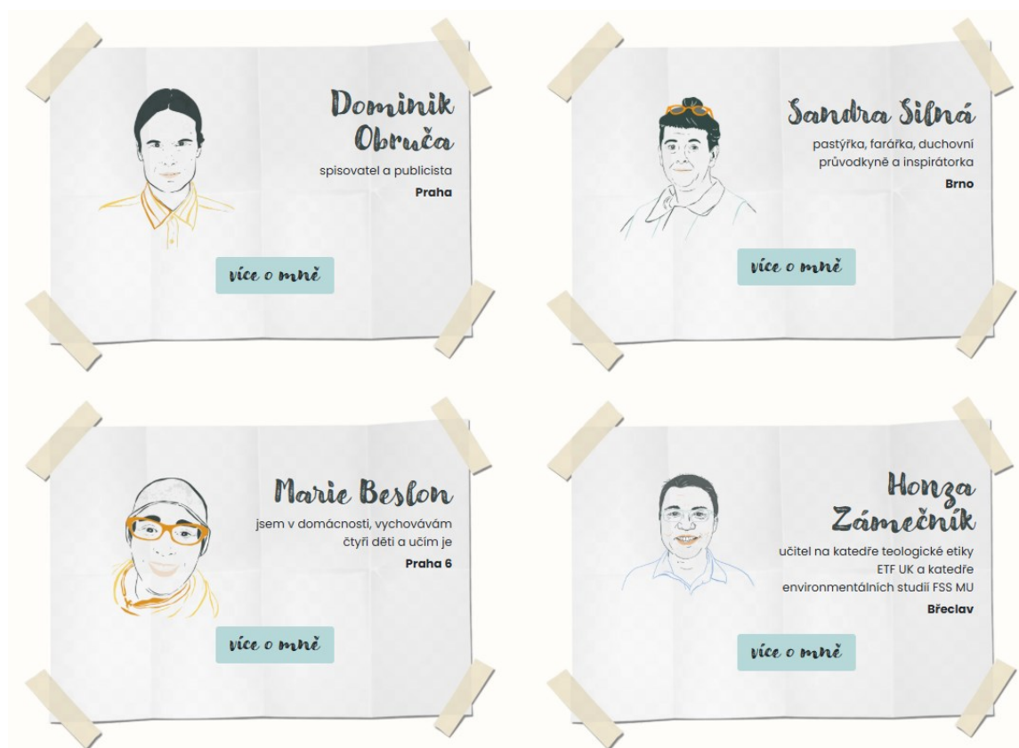
Ukázka webové sekce Síť

Na webových stránkách pečujeme o rubriku Síť. V té mají své profily příznivci a podporovatelé Společného domova a mohou zde taky propagovat svoji činnost. V sekci Zdroje jsme nabídli 13 tipů na ekoteologické knihy přeložené do češtiny s úvody nebo s odkazy na další informace. V sekci Úvah jsou dostupná zamyšlení českých teologů o významu stvoření.