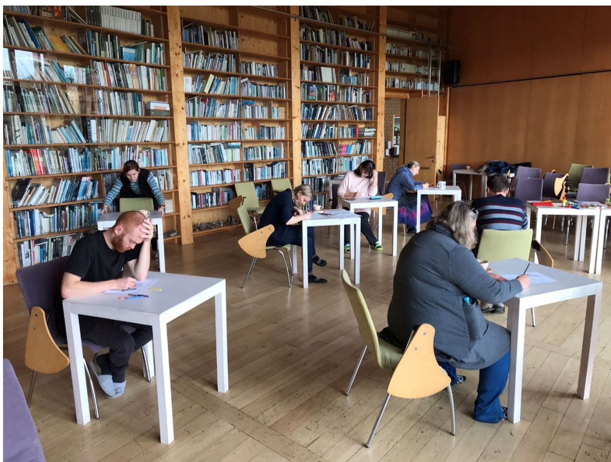
Foto z duchovní obnovy Společného domova ve Sluňákově

Ekumenická síť Společný domov propojuje jednotlivce i společenství z různých křesťanských tradic v Česku a na Slovensku, kteří vnímají ekologické otázky a klimatickou krizi v kontextu své víry a chtějí pečovat o svět jako o společný domov. Naše síť zprostředkovává příležitosti k dialogu, šíří ekoteologické zdroje a inspiruje k proměně myšlení i nové praxi.